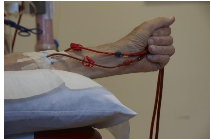
Registratie 'monitoring vaattoegang'